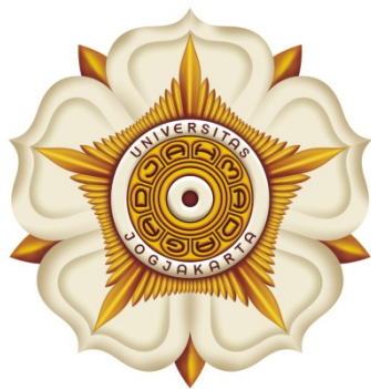
Gb. 1. Lambang 3 (Tiga) Dimensi

Pada awal mulanya, Lambang Universitas Gadjah Mada diwujudkan dalam kalung jabatan Presiden Universitas, Sekretaris Senat, dan Ketua Fakultas. Selanjutnya juga diwujudkan dalam warna-warna dari universitas, dalam vandel dan dalam Tongkat Staf pedel.